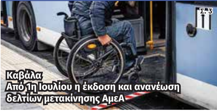
Καβάλα Από 1η Ιουλίου η έκδοση και ανανέωση δελτίων μετακίνησης ΑμεΑ