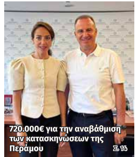
720.000€ για την αναβάθμιση των κατασκηνώσεων της Περάμου Σ. 14