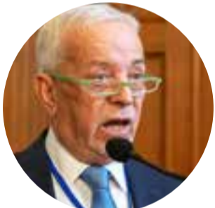
Γράφει ο Νικόλαος Τσιλογεώργης

Τι μεγαλύτερη χαρά στον κόσμο τον επάνω, Να μαρτυρήσω ζωντανός, λεύτερος ν' αποθάνω; Ευχαριστώ σε, πλάστα μου, μεγαλοδύναμέ μου, Που τέτοιο θαύμα για να δω, δεν ήλπιζα ποτέ μου. Μ' αυτούς τους ενθουσιώδεις και σχεδόν ερωτικούς στίχους χαιρέτησε ο ποιητής Ιωάννης Κωνσταντινίδης την Απελευθέρωση της Καβάλας στις 26 Ιουνίου 1913. Δεν υπήρχαν καταλλήλότερα χείλη για να υμνήσουν και να λαμπρύνουν την ημέρα από αυτά του Ιωάννη Κωνσταντινίδη, ο οποίος στάθηκε η ψυχή της πόλης για μισό περίπου αιώνα και πρωτοστάτησε σε κάθε πνευματική και εθνική εκδήλωση της ελληνορθόδοξης κοινότητάς της μέσα σε συνθήκες εξαιρετικά δύσκολες.