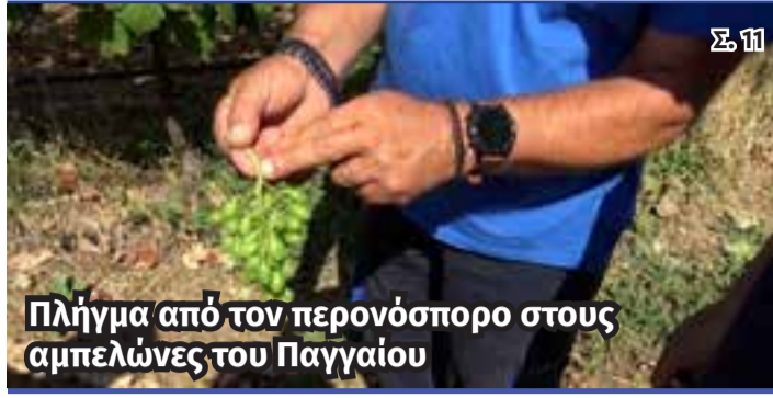
Πλήγμα από τον περονόσπορο στους αμπελώνες του Παγγαίου

ΜΕΛΟΣ ΤΗΣ ΕΝΩΣΗΣ ΙΔΙΟΚΤΗΤΩΝ ΕΠΑΡΧΙΑΚΟΥ ΤΥΠΟΥ