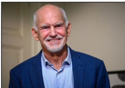
Γιώργος Παπανδρέου Ανάγκη για ένα νέο συμμετοχικό κόμμα στην Ελλάδα