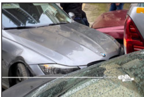
Καβάλα Καταδίωξη διακινητή σε γειτονιές της πόλης