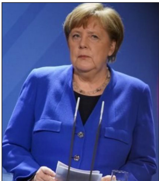
*Του Μιχάλη Α. Αγγελόπουλου

Ο φλεγματικός Winston Churchill –ιδρυτής της Ευρωπαϊκής Κίνησης με την Διακήρυξη του 1948 στη Χάγη– απεφάνθη ότι ο μοναδικός τρόπος για να είσαι σίγουρος ότι η Ιστορία θα σε αντιμετωπίσει με συμπάθεια, είναι να τη γράφεις ο ίδιος. Εκείνος το έπραξε κιόλας. Αλλά, στην εποχή μας, των κοινωνικών δικτύων και του ίντερνετ, τέτοια δυνατότητα δεν υπάρχει για την πρώην, πλέον, Καγκελάρια Άνγκελα Μέρκελ, που, ίσως σημαδιακά, μας αποχαιρέτησε ως χώρα την επομένη του "Όχι", με λόγια σαφώς απαλότερα των πράξεών της εδώ και 11 χρόνια.